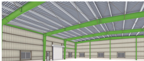
※鉄骨塗装は別途です。